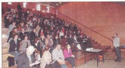
Cent vingt personnes environ se sont retrouvées pour travailler à la préparation de la rentrée.